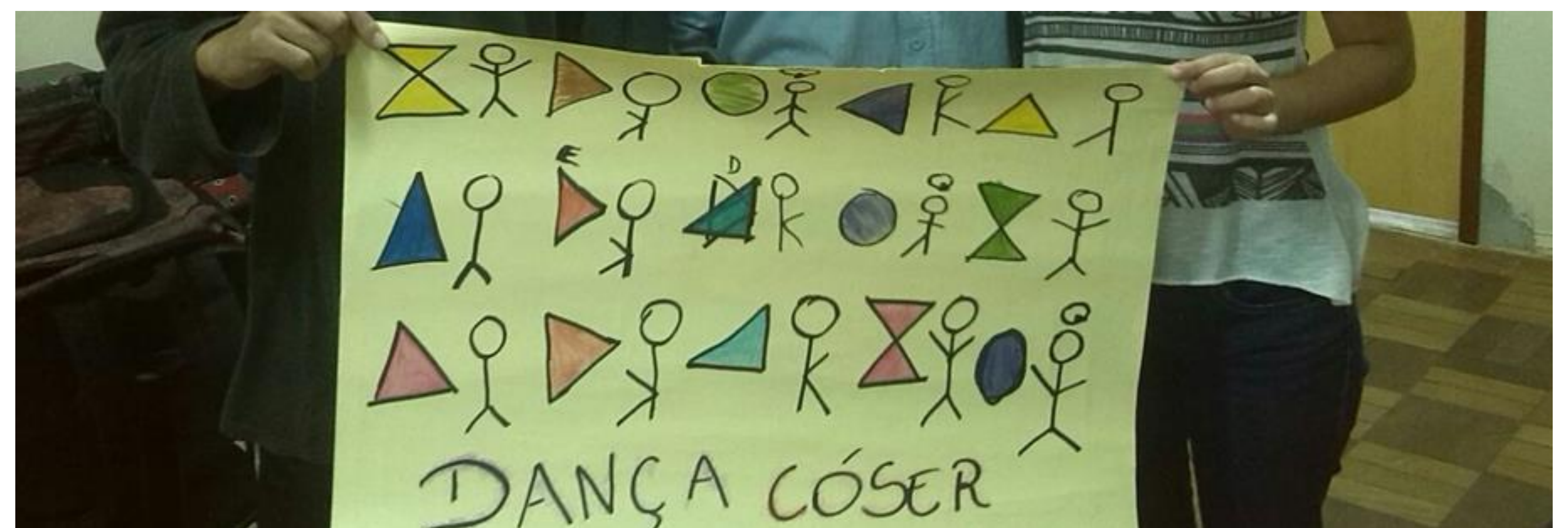
Cartaz confeccionado pelos alunos. Relação Imagem-movimento.