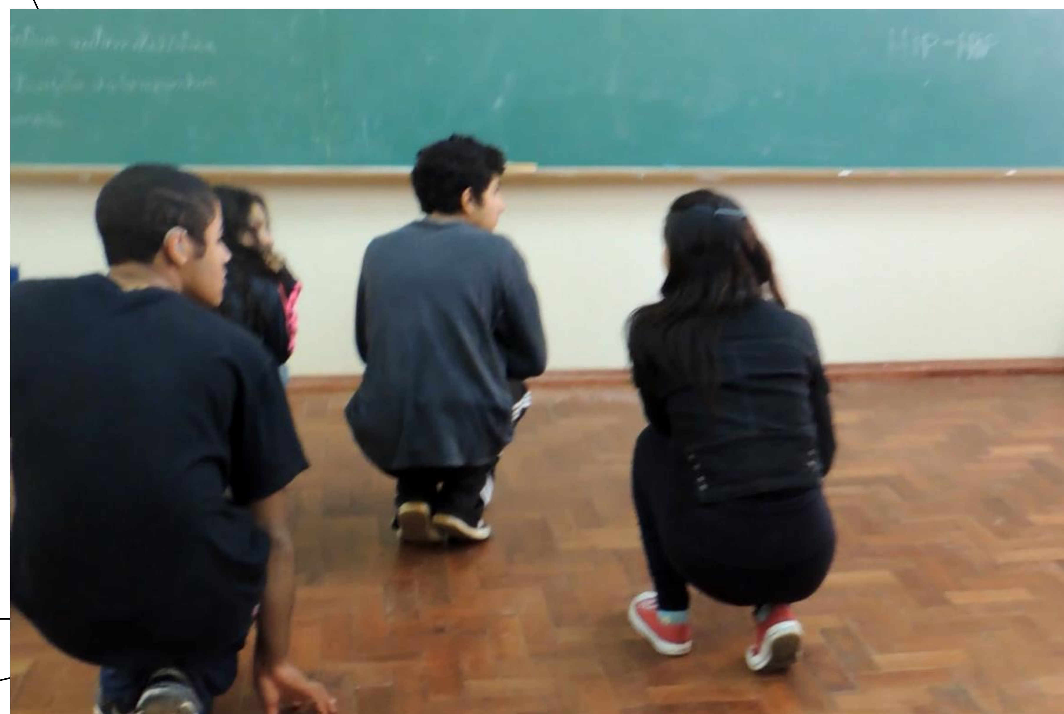
Exercício em possibilidades imagem <> movimento.